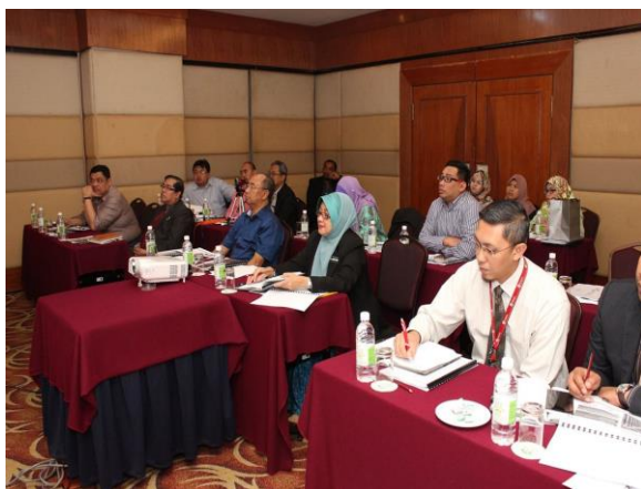
TAKLIMAT HYPERGRID – RISDA & RHSB