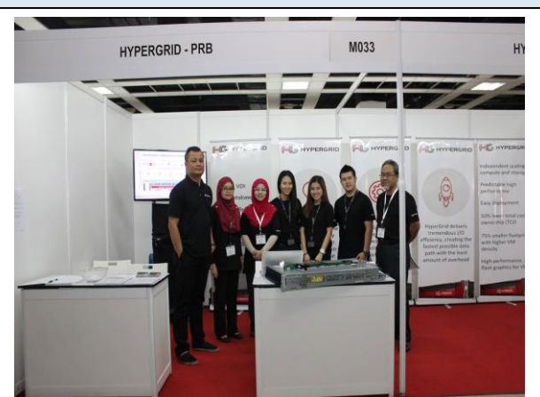
MALAYSIA TECHNOLOGY EXPO 2017