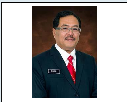
Y. BHG DATO' WAN AHMAD SHABRI ZAINUDDIN BIN WAN MOHAMAD