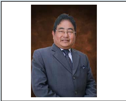
Y. BHG. DATO' Hj. ISMAIL BIN KIJO