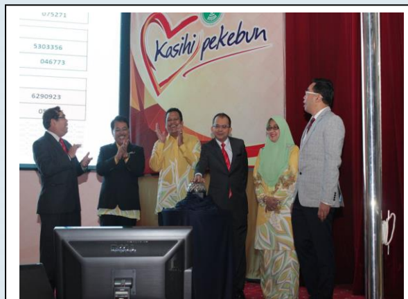
CABUTAN BERTUAH PEMBIAYAAN RISDA 01/2017