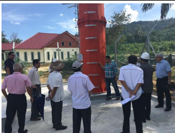
SITE VISIT – TELCO TOWER JOHOR