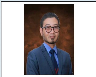
Y. BHG. EN. MOHAMAD NAJIB BIN MUSTAFA