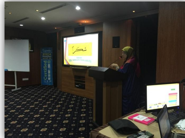
MAJLIS PENERANGAN KEPADA KAKITANGN BERHUBUNG PEMBIAYAAN RISDA