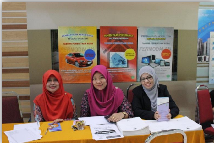
PEMBUKAAN BOOTH DI IBU PEJABAT RISDA